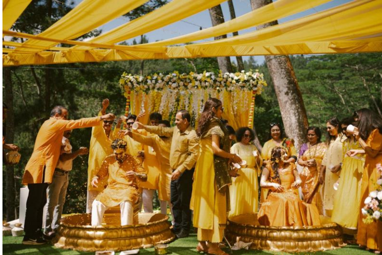
Photographie 4