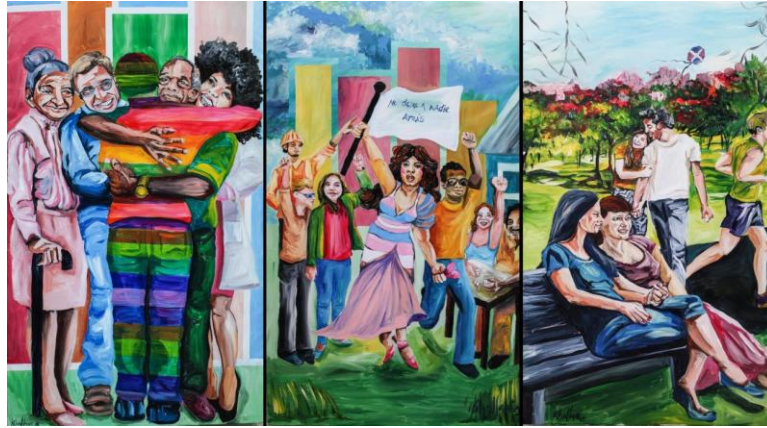
Figure 2 - peinture murale de l'artiste dominicaine Kilia LLANO.

Exemple de présentation : El mural de la artista dominicana Kilia LLANO es una obra vibrante y poderosa que celebra el amor, la lucha y la inclusión de las personas LGBTQ+ en la vida cotidiana. A través de una paleta de colores intensos y una composición dinámica, la artista transmite un mensaje claro: la diversidad es parte esencial de nuestra identidad colectiva.