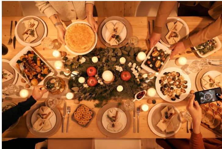
Photographie 10 – photographie de pxhere .