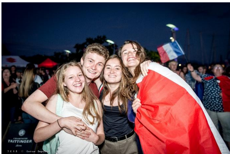
Photographie 6