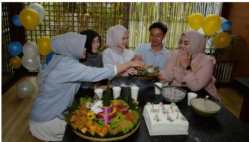
Photographie 8 – photographie de Askar Abayev sur Pexels .