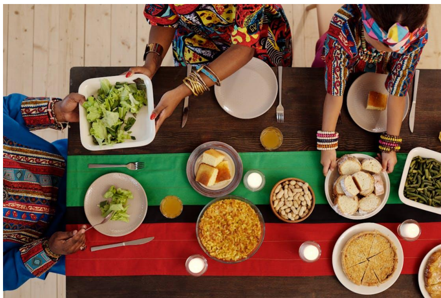
Photographie 9 – photographie de Nicole Michalou sur Pexels .