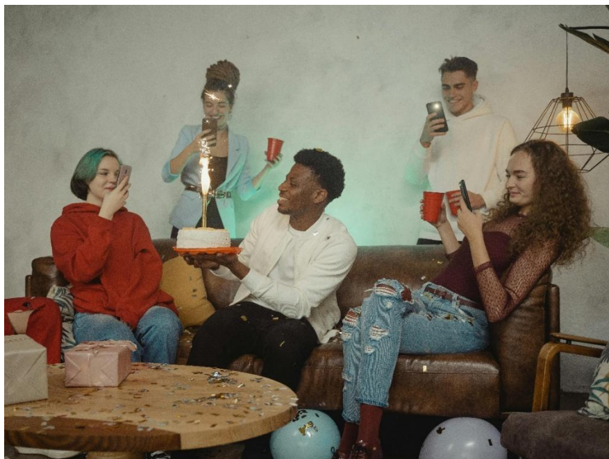
Photographie 12