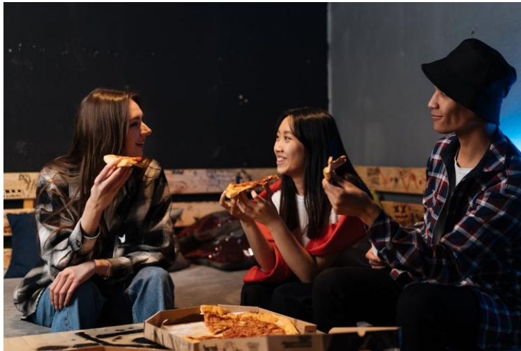
Photographie 7 – photographie de Dhanil Prayudy Wibowo sur Pexels .