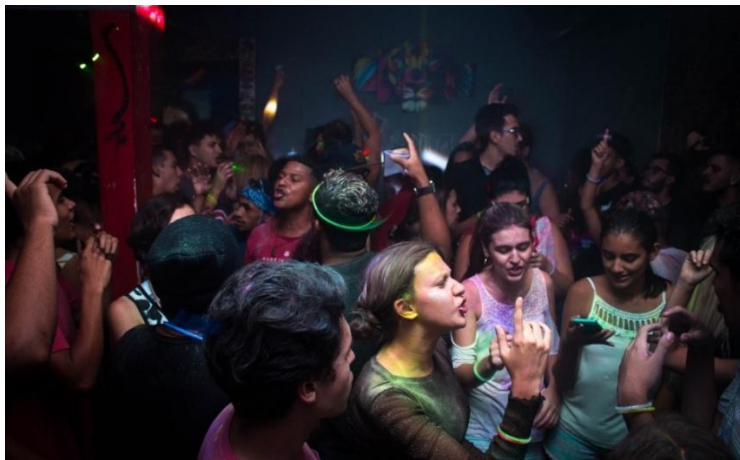
Photographie 11 – photographie de Tima Miroshnichenko sur Pexels , CC0.