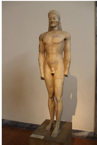
Image 3 – Éphèbe de Critios : statue en marbre de Paros avec des traces de couleurs (ce qui permet de rappeler que les statues grecques étaient peintes), réalisée vers 480 av. J.-C. (Musée de l'Acropole d'Athènes).

Image 2 – Kouros de Volomandra : statue grecque en marbre réalisée vers 560/550 av. J.-C. (Musée national archéologique d'Athènes). Accessible à ce lien .